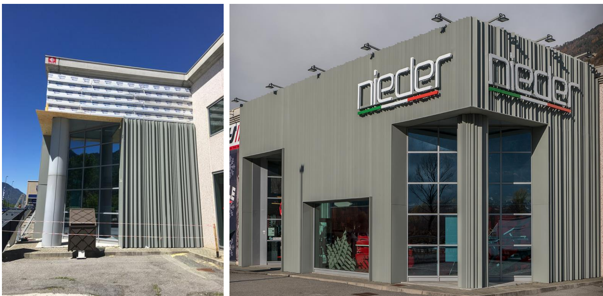
La sede della Nieder cambia volto: il rivestimento metallico personalizzato sulla facciata.

Per il riefficientamento energetico della propria sede, la Nieder ha dunque adottato la soluzione tecnica della facciata ventilata realizzata con il sistema ISOTEC PARETE, costituito da pannelli termoisolanti in poliuretano espanso rigido di spessore 120 mm, rivestito in lamina di alluminio e dal correntino metallico integrato, preaccoppiati in stabilimento. Questa soluzione permette di realizzare rapidamente e con semplicità un impalcato portante, termoisolante e ventilato , la cui continuità, assicurata dalla battentatura perimetrale, lo rende privo di ponti termici .