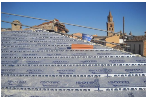
I pannelli ISOTEC XL plus in sequenza di posa sulla copertura del palazzo a Teramo

Il pannello ISOTEC XL plus di Brianza Plastica restituisce funzionalità ed efficienza energetica ad una vecchia copertura, posato in sinergia con il pannello CELENIT N.