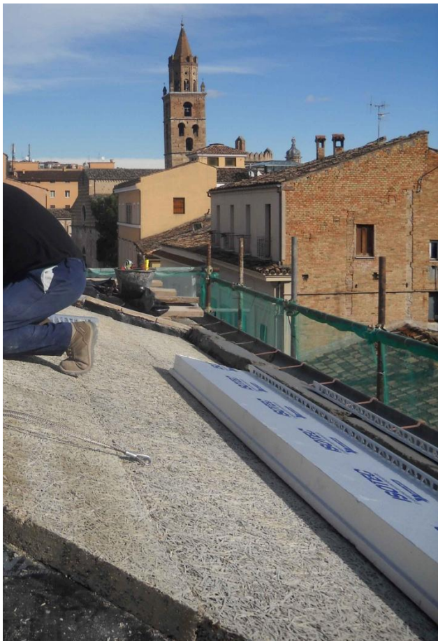
Il sistema ISOTEC XL plus + CELENIT N

Periodo estivo: Il pannello CELENIT N in lana di legno mineralizzata presenta un'elevata inerzia termica grazie all'alto calore specifico e all'elevata densità. Questo assicura migliori proprietà di sfasamento e attenuazione, e un valore Y_{ie} < 0,10 \text{ W/m}^2\text{K} . Una trasmittanza termica periodica inferiore a 0,20 \text{ W/m}^2\text{K} oltre a rispettare il requisito minimo di legge, aumenta il comfort all'interno dell'abitazione.